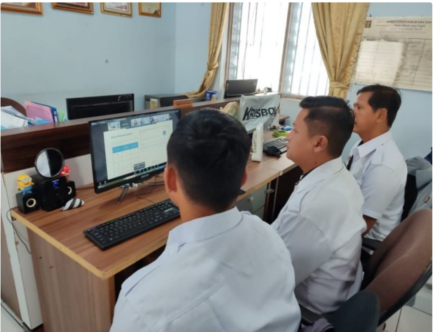
Bangun Citra Positif Pemasyarakatan, Tim Humas Lapas Besi Ikuti Penguatan Oleh Ditjenpas

CILACAP – Lembaga Pemasyarakatan Kelas IIA Besi mengikuti kegiatan "Penguatan Kehumasan Pemasyarakatan" yang diselenggarakan oleh Direktorat Jenderal Pemasyarakatan, Rabu (09/10/2024).